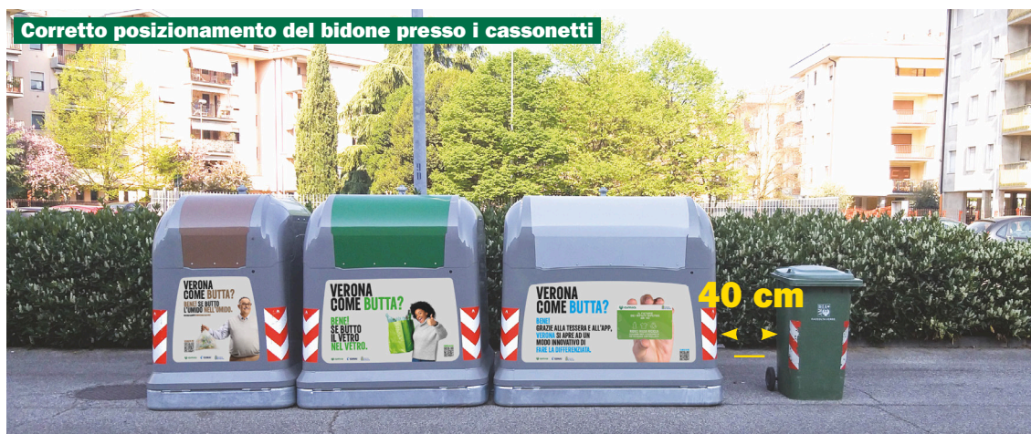
Corretto posizionamento del bidone presso i cassonetti

Il bidone deve essere posto sul lato destro o sinistro della postazione cassonetti più vicina alla propria abitazione in maniera tale che sia distanziato di 40 cm dai cassonetti. Il servizio necessita dell'iscrizione attraverso il sito aziendale www.amiavr.it sul quale, nell'apposita sezione, vi sono tutte le informazioni necessarie.